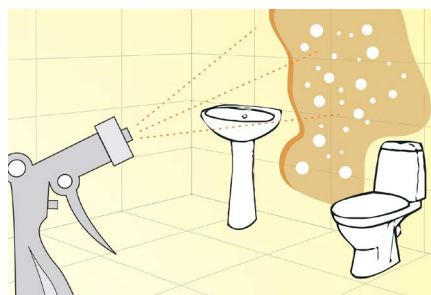
APLICAÇÃO DO PRODUTO

PROGRAMA DE LIMPEZA E SANITIZAÇÃO: FÁCIL, SIMPLES E SEM CONTATO DIRETO DO OPERADOR