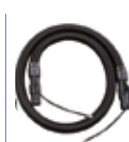
MANGUEIRA Modelo: EJ 5811