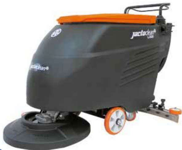
LJ50B | LJ50E