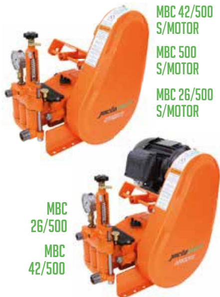
MBC 42/500 S/MOTOR